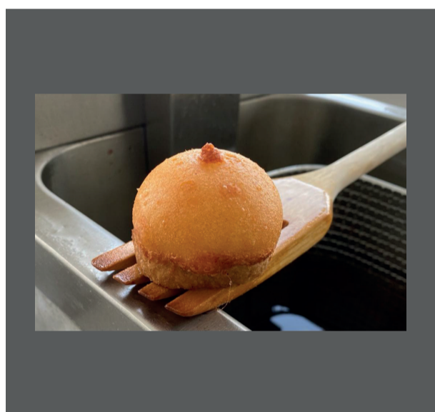
Malakoffs au Vacherin Fribourgeois