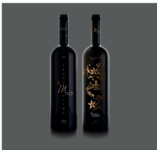
Vin blanc Rauschling Magnificents Un accord parfait pour la fondue